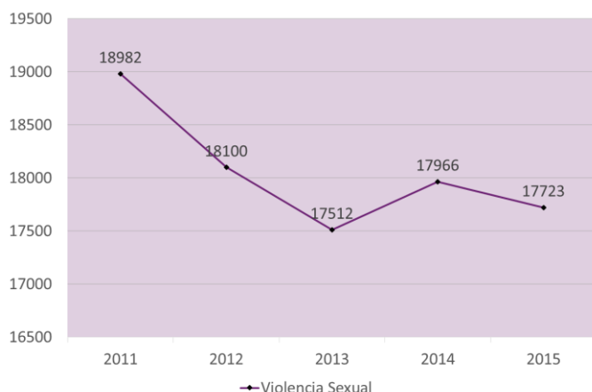
Gráfico No. 1 Comportamiento de la violencia sexual contra mujeres. 2011-2015

Fuente: Elaborada por la Corporación Sisma Mujer a partir de información obtenida del INML-CF. Respuesta a derecho de petición del 7 de marzo de 2016. La información de 2015 es preliminar y está sujeta a cambios por actualización.